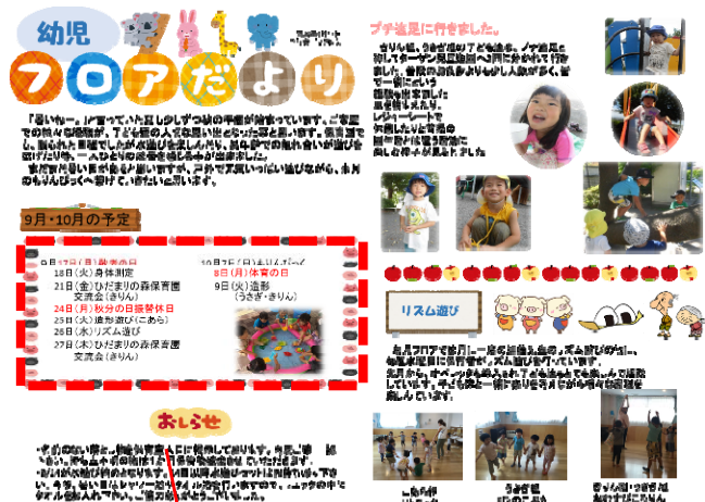
予定の欄に造形の日を記載