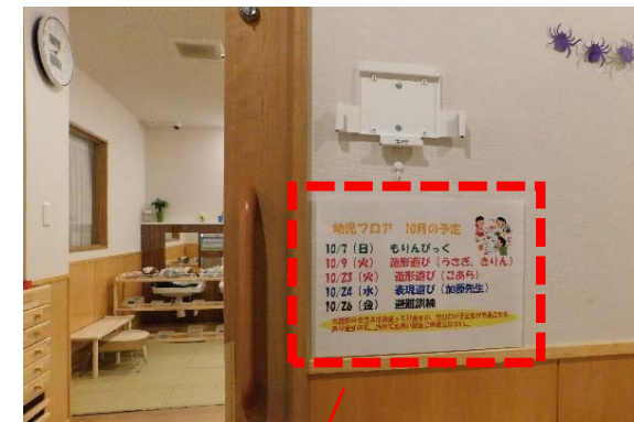
幼児フロア入口扉横に 主要予定を掲示